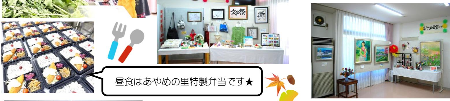
昼食はあやめの里特製弁当です★